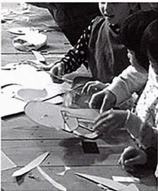
影絵の素材づくり

出演者と一緒に影絵の素材づくりと投影 琵琶・箏・尺八・パーカッションの演奏を体験!